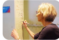
Handtekening op onze schrijverspilaar