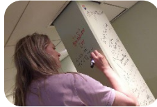
Handtekening op onze 'schrijverspilaar'