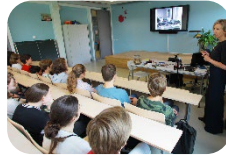
Bezoek in de collegezaal